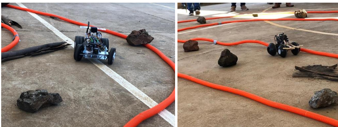
Imagen 1. Ejemplo de circuito de competencia